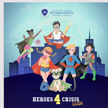
Progetto bambini "Heroes4Crisis Kids"