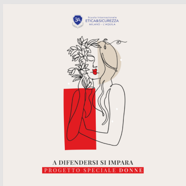
A difendersi si impara