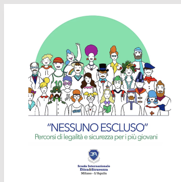
Progetto adolescenti "Nessuno escluso"